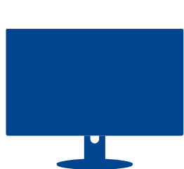
Heras cloud portal